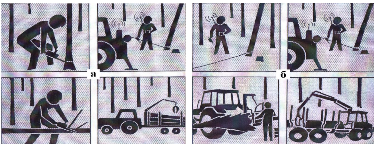
Фиг. 3. Съвременни методи и технологии изпитани в България: а) кастрене на клоните с моторен верижен трион и б) машинно кастрене с процесор

В България са изпитани нови съвременни методи и технологии от световната практика (Фиг. 3). Общата дневна производителност е 25-30 м 3 .