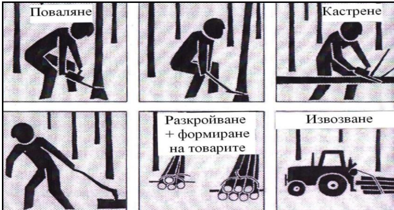
Фиг. 2. Организация на работа с предварителна подготовка на товарите

Основни средства за провеждането им са леките бензиномоторни триони, селскостопанските и специализирани колесни трактори, малките преносими лебедки и конете. Изследвани са технологии за добив на цели стъбла и добив на сортименти. При добива на цели стъбла в сечището, повалянето на дърветата и разкрояването на стъблата е извършено с леки бензиномоторни верижни триони, а кастренето на клоните с брадва и на по-дебелите - с моторен трион. Предварителното формиране на товарите в технологичните коридори и до просеките е извършено ръчно или с малка лебедка "Пионер", както и с лебедката на тракторите „Universal-651”, „Т-40А”, „МТ8-132” и „ШТ-40”, като стъблата са ориентирани с дебелия им край в посока на извоза. За извозване на стъблата са използвани посочените трактори. Накрая е извършено разкрояване на стъблата с бензиномоторните триони и ръчно сортиране и рампиране на сортиментите на временен склад. При добива на сортименти в сечището за повалянето на дърветата са използвани леките бензиномоторни триони, а кастренето на клоните е извършено с брадва или с моторни триони. За разкрояването на стъблата са използвани само бензиномоторни триони. Подготовката на товарите за извоз е проведено чрез частично сортиране и нареждане на сортиментите в сечището. За извозване на материалите са използвани сортиментен трактор "Б-1203" или сортиментно ремарке "ТП-50Г".