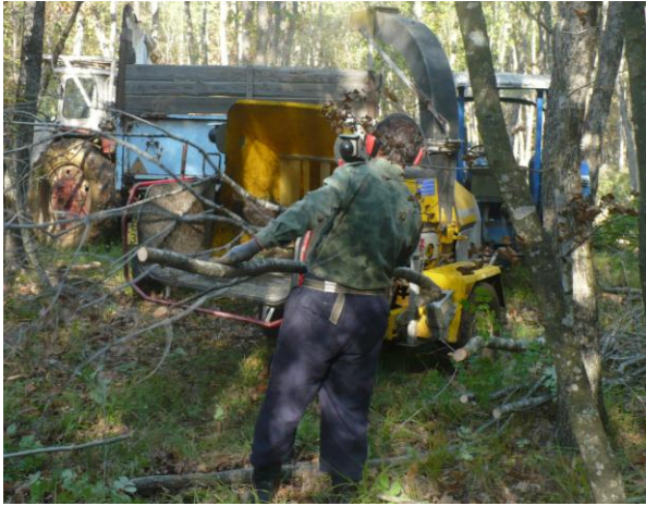
Фиг. 2. Процес на насичане на лесосечните отпадъци в сечището с прикачна секачна машина (частна гора „Ходжа Юрт“)

Самите трески се натоварват чрез въздушна струя директно на пригодно ремарке или камион. Добивът на ден на трески – 14-15 m 3 . Средногодишно – 15 m 3 x 25 дни в месеца x 7 месеца в годината = 2625 m 3 . Технологиата продължава по-нататък в стационарни условия, като от получените трески в гората след тяхното преработване, се произвеждат брикети от лесосечни отпадъци (Фиг. 3).