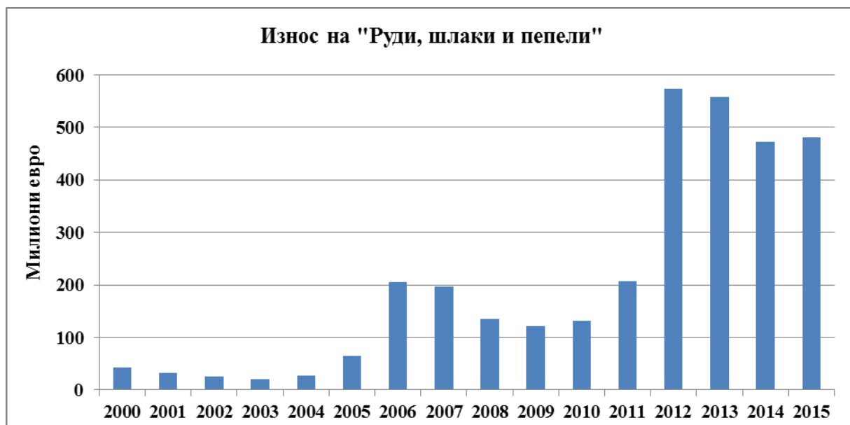
Фиг.1 Износ на „Руди, шлаки и пепели” през периода 2000-2015 г. в стойностен обем (в млн. евро)

В периода от 2000 г. до 2015 г. клас „ Руди, шлаки и пепели ” заема между 1% и 3% от целия стоков износ на България. Стойностите на реализирания експорт на стоки от този клас са представени графично на фигура 1.