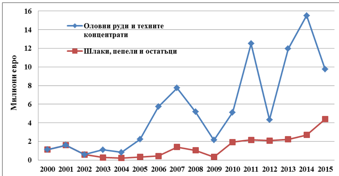
Фиг. 3 Износ на „Оловни руди и техните концентрати” и „Шлаки, пепели и остатъци” през периода 2000-2015 г. (в млн. евро).

Графиката е построена от авторите по данни на НСИ