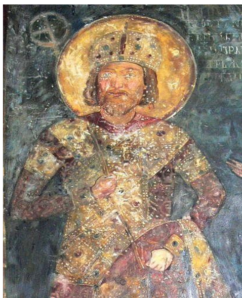
Константин II Асен( 1396-1422 г.)

Връщайки се отново към Михаил Мокса, обстоятелството, че Баязид направил Срацимир данник може да се тълкува, че Видинското царство продължило да съществува и след това под някаква ограничена форма на автономия, а носител на тези задължения станал синът на плененият цар – Константин. Като допълнение добавям, че Видин се споменава като османски санджак едва през 1430 г. Константин II Асен е управлявал западно от Видин като имал държава, васална под някаква форма на Османската империя. При завоюването на европейските територии Османската империя е действала целенасочено и постепенно, като е ограничавала властта и правата на победените народи и е изисквала от тях данък и пращане на войски за завоюване на нови територии.