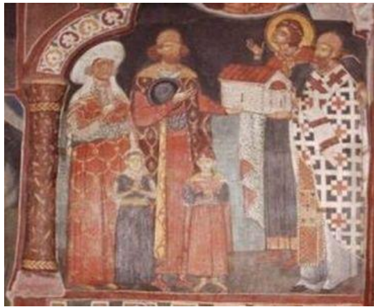
Смъртта на последния български владетел през 1422 г.

Константин II Асен е бил васален на владетеля Османската империя и е запазил някаква власт. Околните държави при кореспонденция с него и в хрониките се отнасят, като към български владетел. Няма голямо значение как точно го титулуват, защото владетелските титли са различни при различните народи и се превеждат по различен начин. При това те са избороени в географската последователност на "фронтони държави" от унгарска гледна точка - от запад на изток, т.е. от дясното към лявото крило на един военен фронт. Сигизмунд съобщава на своя френски съмишленик радостната вест, че българският цар и влашкият воевода са "се върнали" под неговото върховенство. Това означава, че до този момент те са признавали нечий чужд сюзеренитет. Излишно е да се доказва, че този сюзеренитет е османски. Факт е обаче, че за унгарския крал в 1404 г. (и преди това!) Видинското царство съществува, а "император Константин" не е "въстаник", а реално управляващ земите си владетел. В своя дарителска грамота за манастирите "Тисмана" и "Водица" във Влашко от 1406 г. сръбският деспот Стефан Лазаревич постановява: "Всеки, който побегне от земите на царството ми в Унгарската (Унгарската) земя или пък в Българската земя, мой човек или мой властелин, и пребивава там три години, или две, или една, и поиска да се върне (...), нека бъде свободен да дойде..." Логиката отново сочи, че споменатата "Българска земя" явно е държава, а не османска провинция.