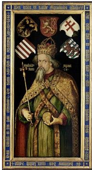
Сигизмунд Люксембургски(1410-1437 г.)

В писмо на крал Сигизмунд до неговия приятел и съюзник, бургундския херцог Филип, от 1404 г. са изброени воюващите против османците унгарски съюзници: Господин Остоя, крал на Босна (...), знатният господин Стефан, деспот и дук на Рашка (Сърбия), известният Константин, прославеният император на България, и Мирчо, воеводата на трансалпинска Влахия (...). Последните двама също се върнаха в лоното на Наше Величество, под наше подчинение, много пъти нападаха смело гръцките области и други области, които и досега се владеят от турците; спечелиха триумфална победа над враговете и слава за себе си...