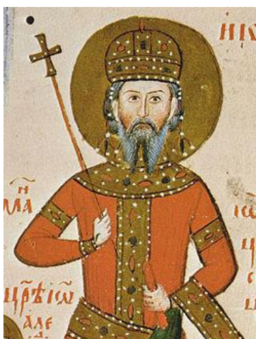
цар Иван Александър( 1331-1371)

Търновското царство пада първо през 1393 г. окончателно, след като на няколко пъти поема васални задължения и после ги отхвърля. Видинското царство влиза в отношения с Унгария, като през 1365-1369 г. е под силното ѝ влияние. Някъде пишат, че е било завладяно от унгарците, но мисля, че Видинското царство не е губило през споменатия период напълно своята независимост.