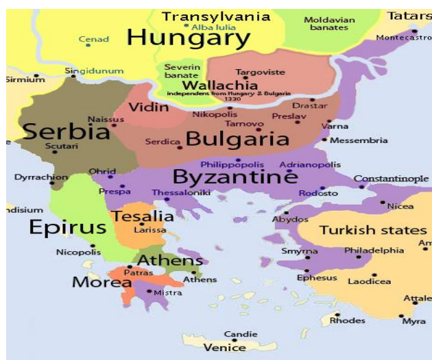
Карта на Балканския полуостров от края на XIV в.

българските земи - цар Иван Шишман, деспот Иванко, крал Марко ("Крали Марко" във фолклора) и "господин" Константин Деянов. През посочената година "Сарадж" и "Кьостендил" (Константин Деянов) участват като османски васали в един поход на султан Мурад I в Мала Азия. През 1388 г. същите двама български владетели се готвят за османската офанзива срещу Сърбия, за разлика от Иван Шишман и Иванко, които се отклоняват от поетите задължения към султана. Пресилено е да се мисли, че Иван Срацимир винаги е оставал лоялен към османците. През 1391 г. е регистриран наказателен поход към Видин, след което в града е настанен турски гарнизон. Срацимир не подкрепя своя брат Иван Шишман нито през 1393 (падането на Търново, 17 юли с.г.), нито през 1395 г.